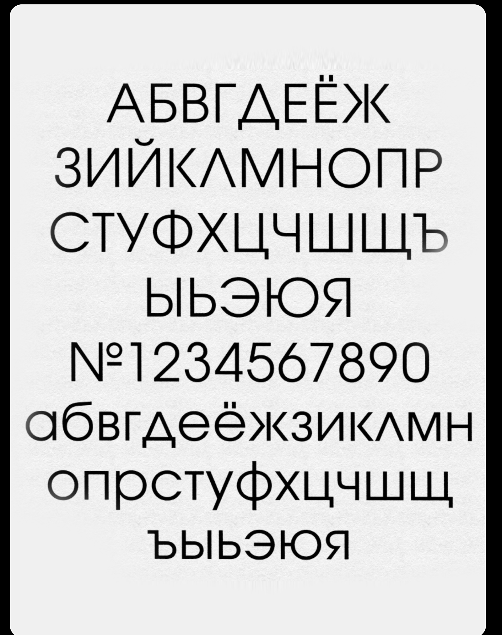
☞ Example of rounded Cyrillic. Avant Garde Gothic Cyrillic , by Vladimir Yefimov. First Russian typeface which pioneered a long-term joint venture with an American company. ParaGraph, 1993. Towards an open layout: A letter to Volodya Yefimov.